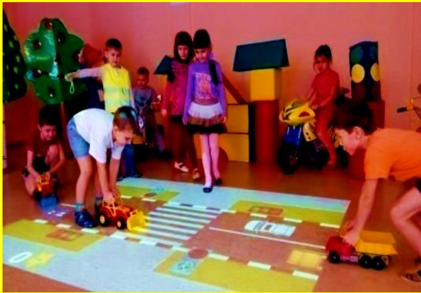
Интерактивный пол и ПДД